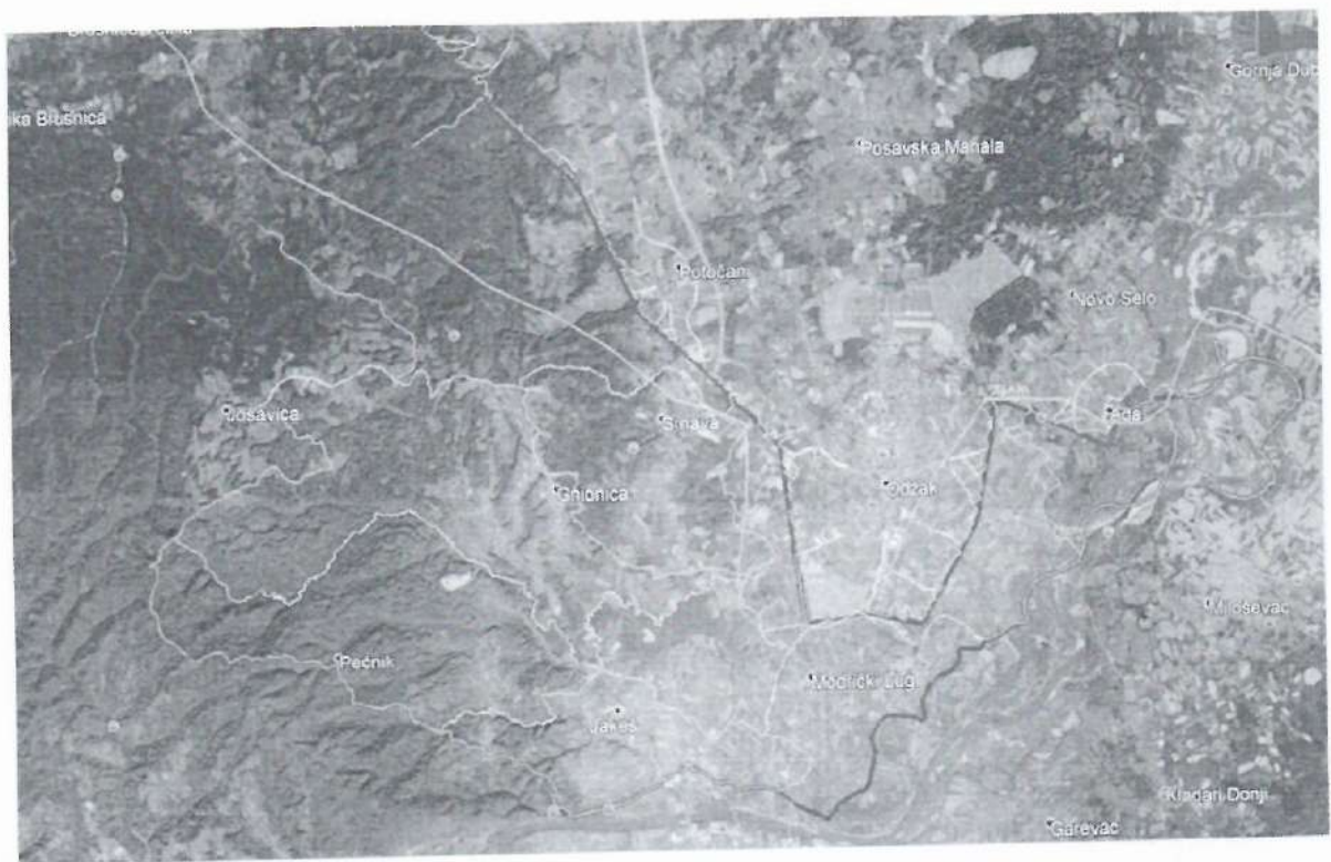
GRAFIČKI PRIKAZ NA KATASTARSKOJ PODLOZI (Trenutno stanje)